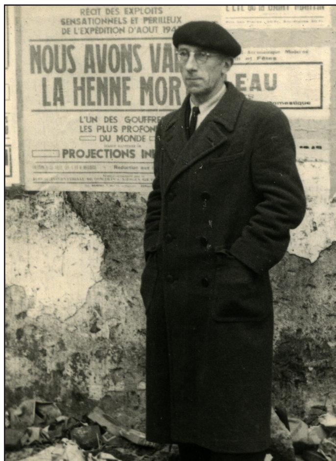
Norbert Casteret à Nantes le 9 décembre 1947