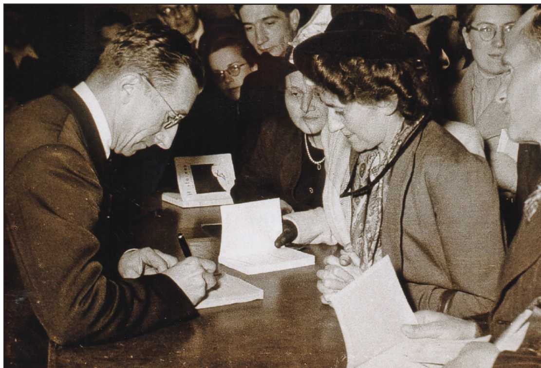
Séance de dédicaces de Norbert Casteret suite à une conférence

2-Ton négatif : « grosse affluence, désordonnée, bruyante », « conférence pénible parce que trop longue pour des enfants », « projection détestable » « un ivrogne dans la salle ! », « salle du Cercle Laïque (pas belle) pleine, beaucoup de désordre en début pour placer le public », « 1300 enfants, certains trop jeunes font du bruit et me fatiguent », « salle trop petite et sordide », « conférence détestable devant public maigre et figé, j'écourte, j'élude », « peu de