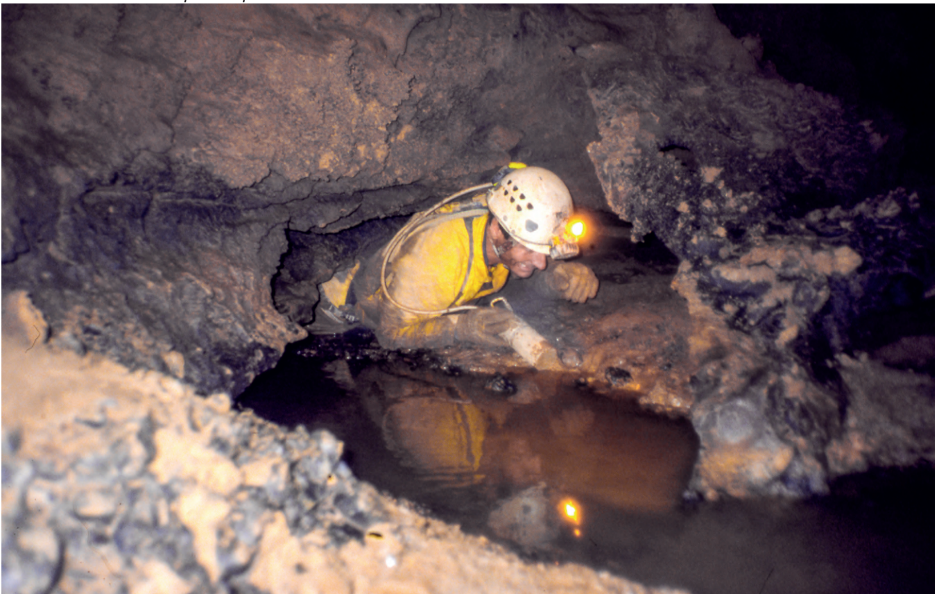
Photo 3 - L'étroiture après le puits MAO.

En descendant un ressaut de trois mètres sur la droite, on accède à une galerie étroite toujours descendante. Au fond, un ramping étroit et boueux débouche au sommet d'un ressaut de deux mètres (demi-tour à négocier à l'avance).