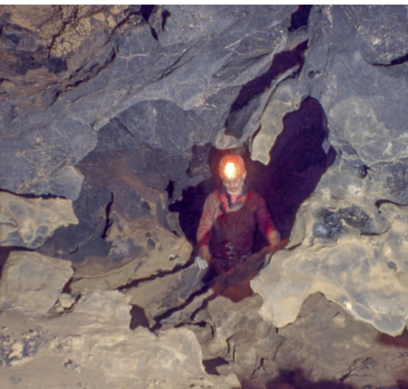
Photo 4 - La salle sablonneuse en bas du puits MAO.

salle. La continuité évidente empruntée par l'eau est un méandre qui se jette dans un P25 arrosé.