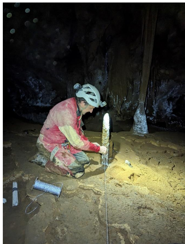
Mise en place de la cordelette