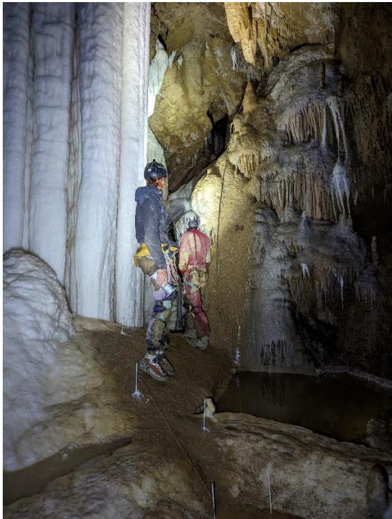
Impossible de nettoyer le sol, cependant un couloir de protection a été mis en place