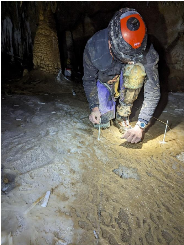
Mise en place de la cordelette