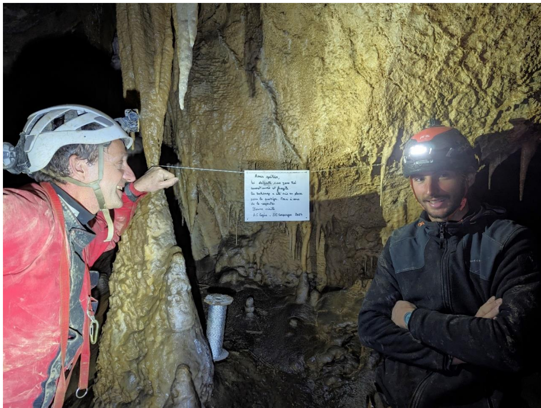
Pose d'un panneau pour sensibiliser les visiteurs