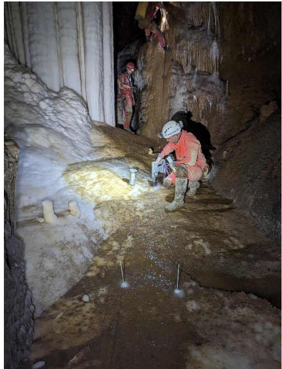
Perçage et mise en place de petits piquets