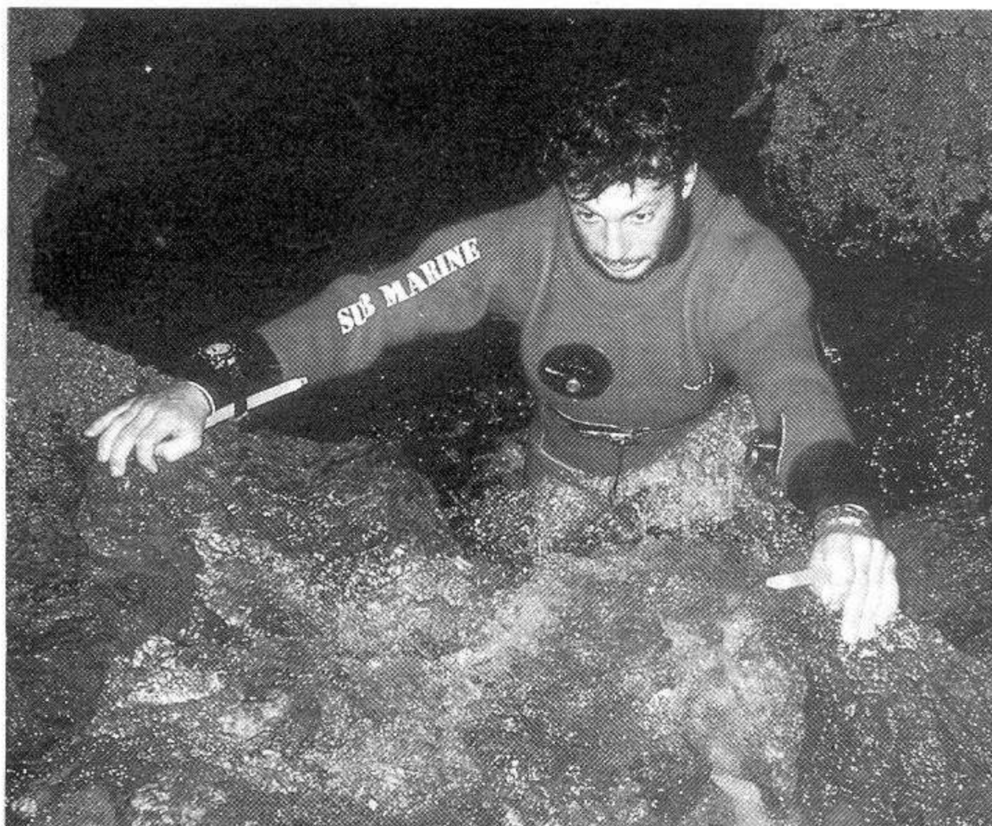
Grotte de la Mescla (Alpes Maritimes). Franchissement de la cascade avant le troisième siphon.

Gouffre de Montaudin (Fouchers) Gouffre-perte désobstrué par le Groupe spéléologique du Doubs. Doline, R 2, étroiture, P 18, méan-