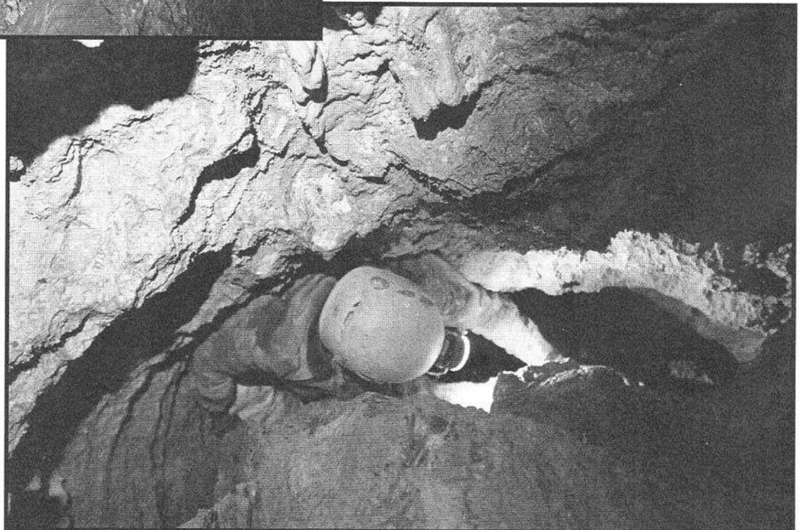
Dans le méandre infernal 2...